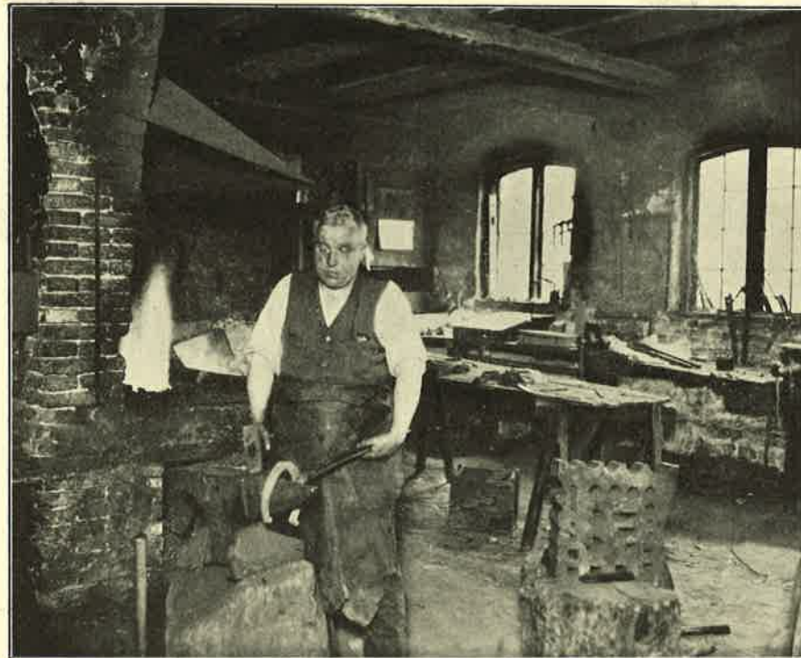
Oldermanden ved Ambolten.

Med Grundloven blev den frie og uhindrede Adgang til Erhverv fastslaaet, og med Næringsloven af 1857 afskaffedes alle Lav. Hermed forsvandt over hele Landet Lavene i deres gamle Skikkelse, men flere Steder opretholdt man som en Fortsættelse frie, faglige Mestersammenslutninger, og saadan gik det i Roskilde. I 1862 vedtog Smedene at fortsætte i en Forening med selskabelige og nogle faglige Formaal. Lige straks turde man kun kalde sig Forening, dog varede det ikke længe, før den gamle, traditionsrige Benævnelse Lav atter vandt Hævd, saa det er Roskilde Smedelav, der den 4. Juli 1936 fejrer sit 500 Aars Jubilæum. — Varetagelsen af de fleste faglige Interesser er nu gaaet over til Smedemesterforeningen for Roskilde Amt, der blev stiftet 1915, men Lavet tager sig endnu af Udskrivning af Svende, d. v. s. Bedømmelse af Svendepøver og Udstedelse af Svendebreve. Fra Jubilæet i 1886 til nu er der ialt udskrevet 214 Svende. I 1904 var man oppe paa det højeste Tal — 12, i de senere Aar har der kun været et Par Stykker eller slet ingen. Paa Jubilæumsdagen vil der blive udskrevet 2 nye Svende.